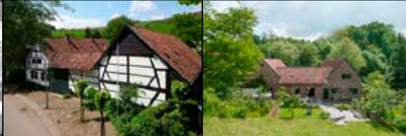
Waterval 7 Meerssen

Gerenoveerde vakwerkboerderij (Carré) met o.a. huisweide, gastenverblijf, wellness/sauna gedeelte en appartement, gelegen in een bosrijke omgeving nabij Meerssen. € 1.200.000,-