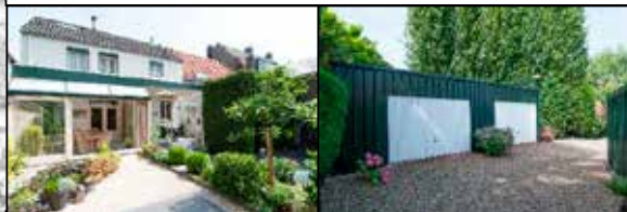
Bilserbaan 9 Maastricht

Woonhuis gelegen op royaal perceel met o.a. 3 garages, een royale multifunctionele ruimte geschikt is voor hobby of werk aan huis, berging, serre en tuin met optimale privacy. € 495.000,-