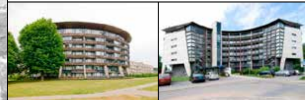
Tinnegietersdreef 46 F Maastricht

Goed onderhouden appartement in "Residence L'Artisan" met eigen privé parkeerplaats in afgesloten parkeergarage, berging en balkon, gelegen nabij alle voorzieningen. € 174.500,-