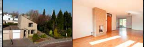
Mèdoclaan 180 Maastricht

Levensloopbestendige woning met garage, woonkamer met openhaard, slaapkamer en badkamer op begane grond, 2 slaapkamers en 2 e badkamer op eerste verdieping. € 335.000,-